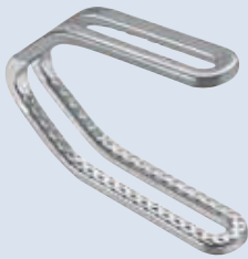
DS (Double-shank) Clip DS (Doppelsteg) Clip Dvigubos kabutės